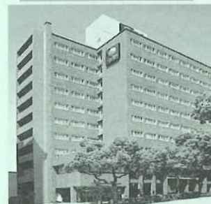
コンフォートホテル