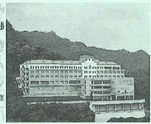
ルークプラザホテル (研修会会場)