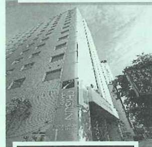
チサングランドホテル